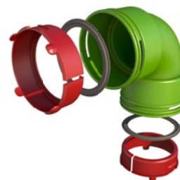
Kit coude AE34C